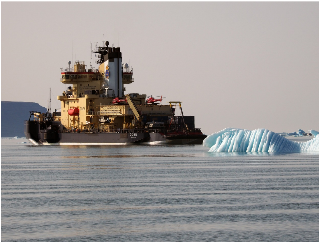
Oden till ankars i Thule.