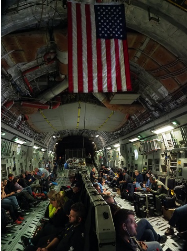
Från C-17 flygplan.