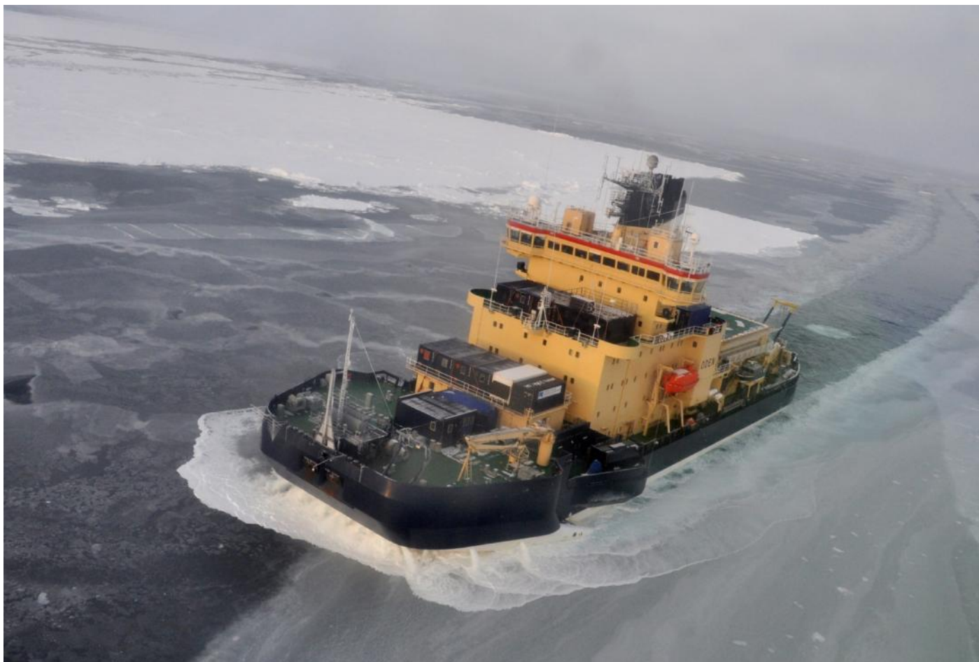
Oden genom isen.